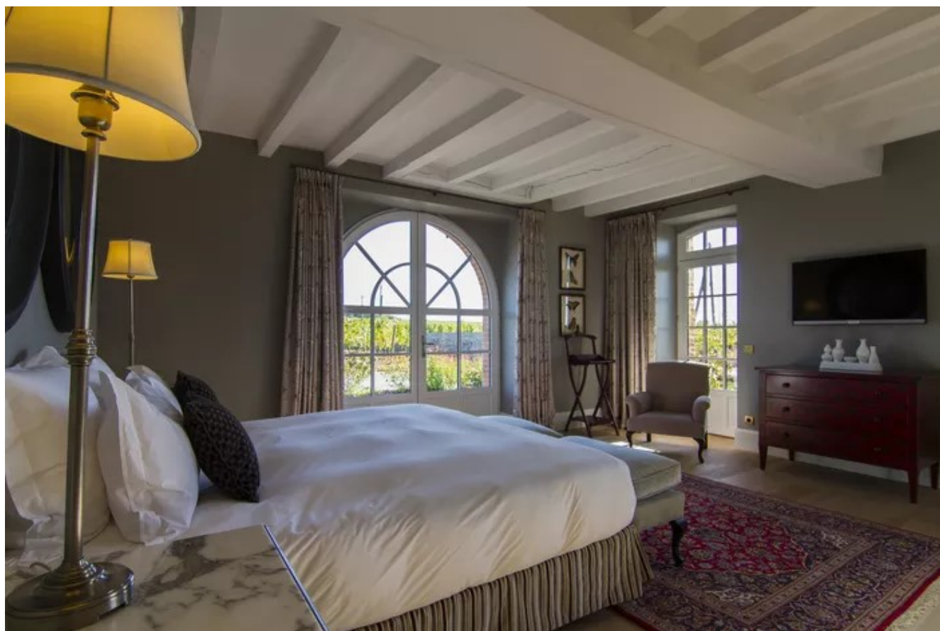
Le Château Soucherie offre une vue panoramique sur le vignoble.

Depuis le Château Soucherie, ancienne métairie des comtes de Brissac, la vue sur la vallée du Layon et ses villages est panoramique. 25 hectares de vignes caressent la bâtisse plantée au sommet d'un coteau. Un lieu empreint de poésie où il est possible de passer une nuit (ou plus). La « Maison des Amis » comprend 4 chambres d'hôtes au style élégant et le gîte « La Maison des Vignes » peut accueillir une dizaine de convives autour de sa cheminée et au bord de sa piscine chauffée. Après le petit déjeuner, agrémenté du miel du domaine, on peut visiter la cave et déguster les vins du Domaine de la Soucherie. Un parcours balisé de 2,5 km dans les vignes vous aidera à comprendre les différents terroirs. Ne manquez pas de déguster le Savennières, Clos des Perrières.